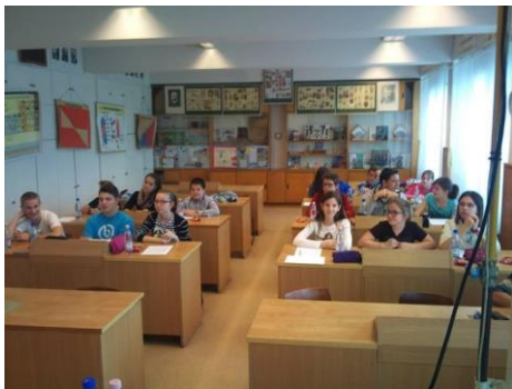
Helyi forduló Tiszaújvárosban

Valamennyi kategóriában a helyszínek legjobbjai automatikusan döntőbe ju-