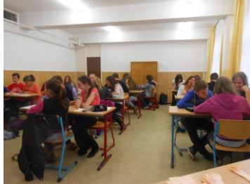
Helyi forduló Egerben