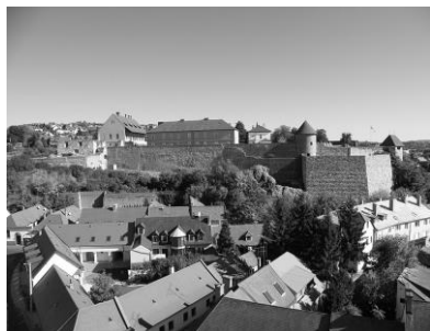
Az egri vár