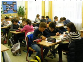
Helyi forduló Egerben