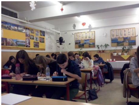
Helyi forduló Egerben

Természetesen idén sem maradt a verseny újítások nélkül: kihasználva a technikai lehetőségeket, a versenyek után tartott eredményhirdetésen azonnal ki tudtuk hirdetni, hogy mely csapatok jutottak be a döntőbe.