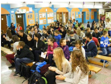
Helyi forduló eredményhirdetése Egerben